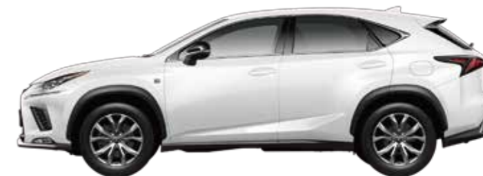
NX300h "F SPORT" 2WD