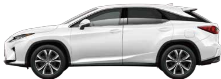
RX450h "version L" 2WD