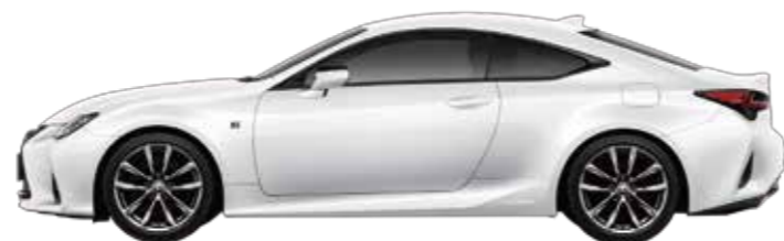
RC300h "F SPORT" 2WD