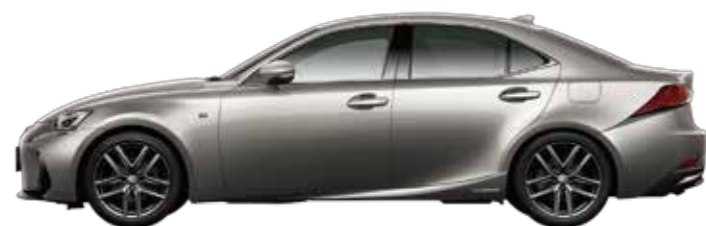
IS300h "F SPORT" 2WD

KINTOによってあなたが手にするのは、クルマではなく、クルマとつき合う喜び。愛車がいつもそばにある、ワクワクする日常です。