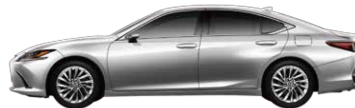
ES300h "version L" 2WD