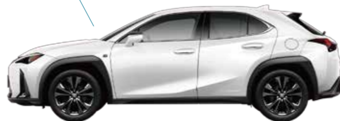
UX250h "F SPORT" 2WD