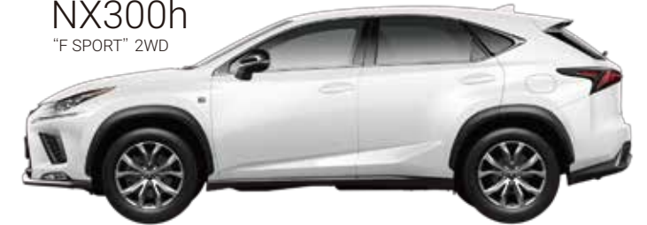
NX300h "F SPORT" 2WD