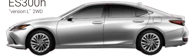
ES300h "version L" 2WD

3年間で6台のレクサスを 乗り換えられるプランです。 憧れの高級車を乗り比べてみたい。 その夢を、KINTOが叶えます。 高級車のある贅沢な毎日をお楽しみください。